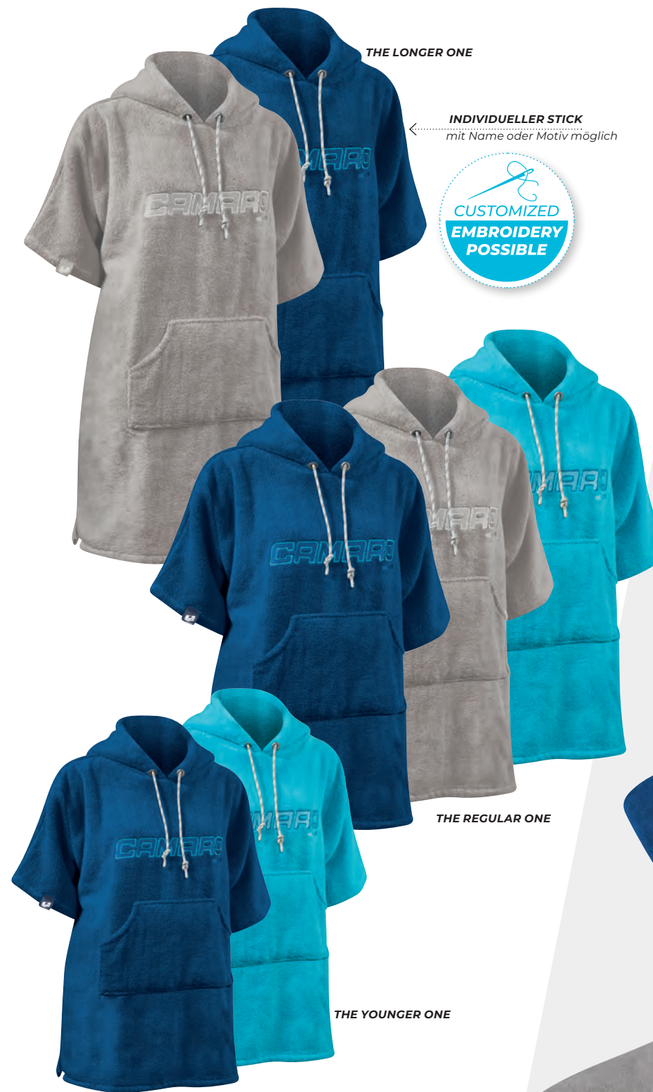
THE LONGER ONE

Einzigtiger Service Wir personalisieren deinen Poncho ganz nach deinen Wünschen – egal ob mit Namen oder Logo. Unser hauseigener Service macht dein Produkt zu einem echten Unikat.